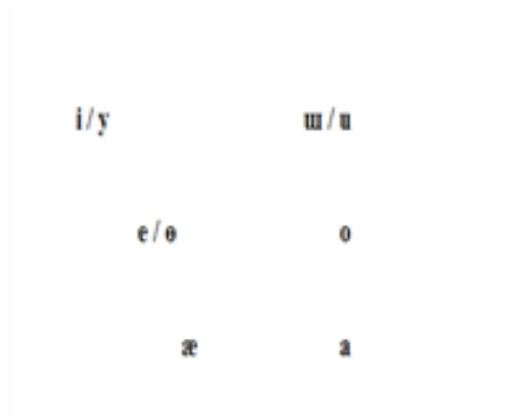
1-сурет — ХФӘ-дегі дауыстылардың көрінісі